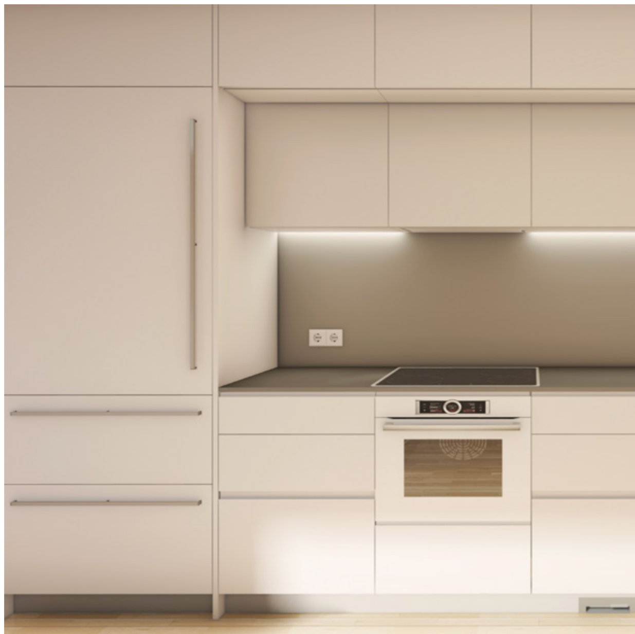
EL MOBILIARIO DE LA COCINA ES DE LAS FIRMAS MÁS PRESTIGIOSAS.