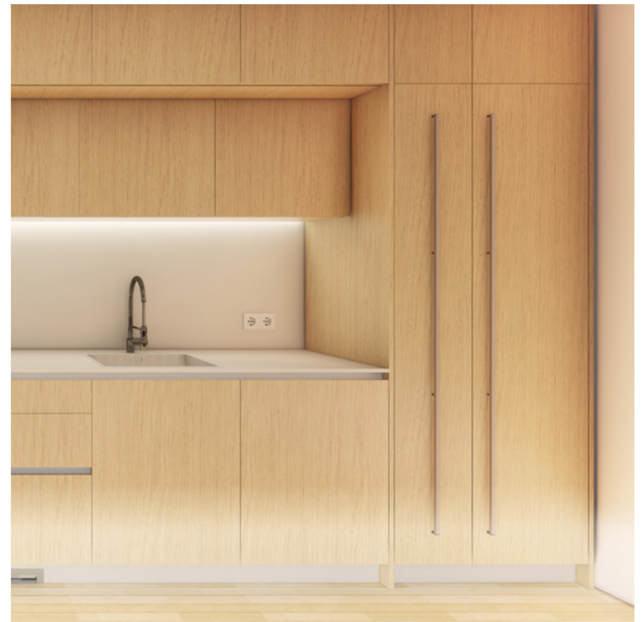
LAS ENCIMERAS SON DE MATERIAL PORCELÁNICO Y LOS ELECTRODOMÉSTICOS ESTÁN INTEGRADOS.