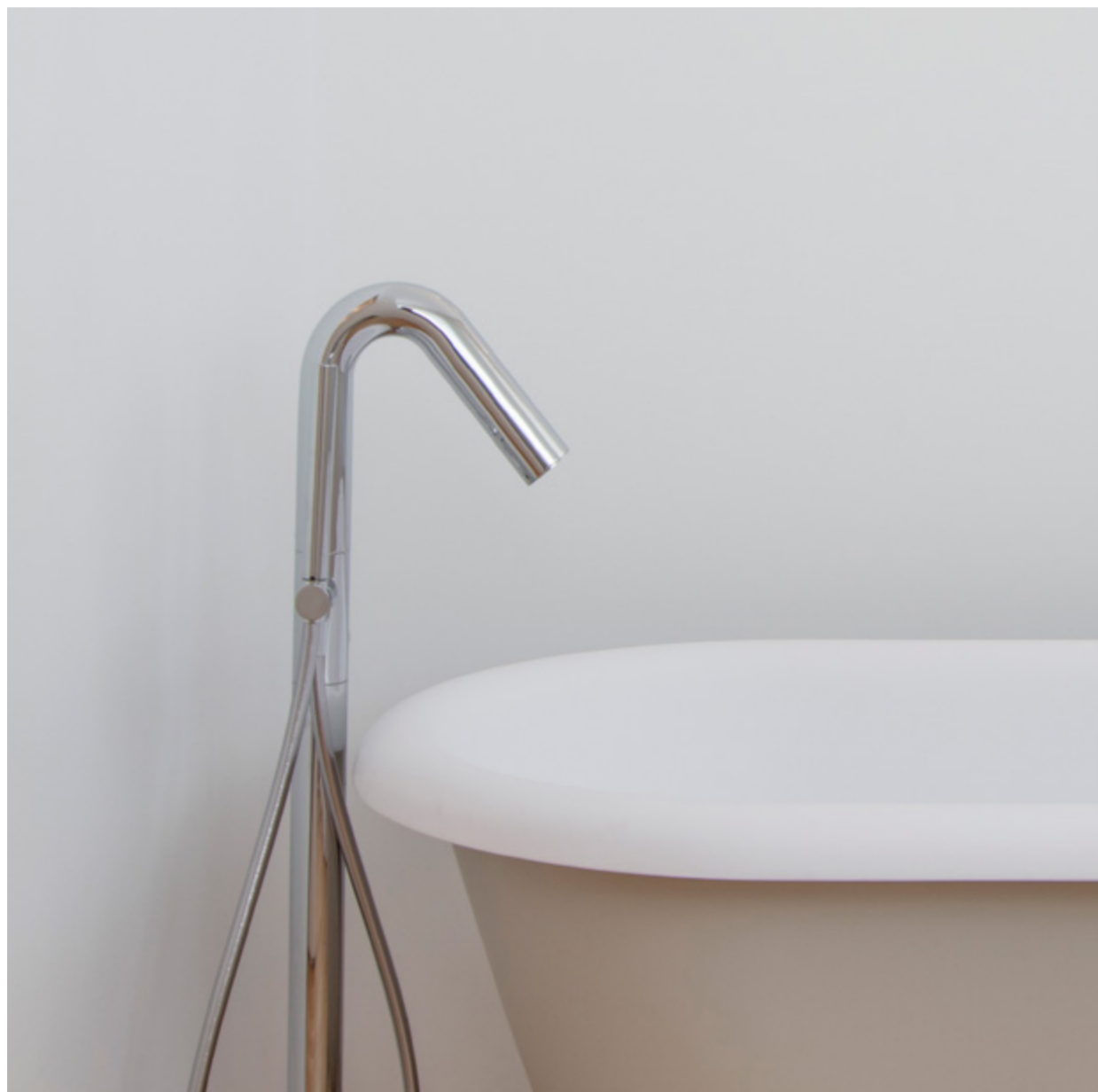
GRIFERÍA TERMOSTÁTICA DE LATÓN MACIZO CROMADO Y SANITARIOS DE PORCELANA BLANCA.