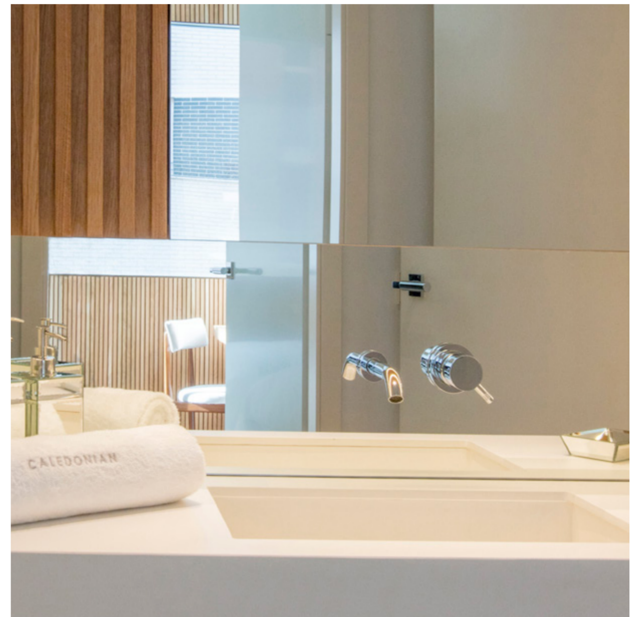
MATERIAL PORCELÁNICO DE GRAN FORMATO, TANTO EN EL SOLADO Y LAS ENCIMERAS COMO EN EL REVESTIMIENTO DE LA DUCHA.